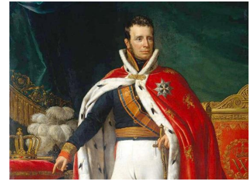
Koning Willem 1

Opdracht: maak in tweetallen een krantenpagina over jouw 19 e -eeuwse BN'er.